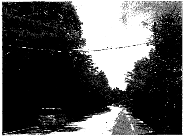
樹上性動物用横断橋