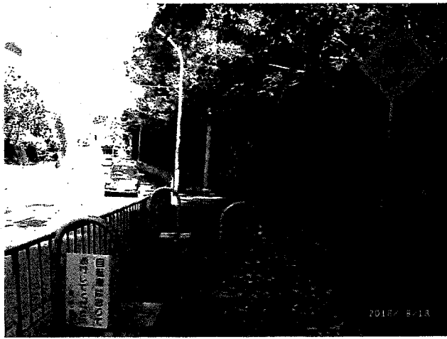
新千里西町2丁目(鳥熊山緑地付近)